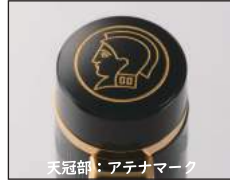
天冠部：アテナマーク

明治より輸入万年筆の需要が高まる中、丸善は低価格で品質の良い国産万年筆の製造に取り組みます。試行錯誤を重ね完成したアテナ万年筆は好評を博しました。約百年前のモデルを現代風アレンジして復刻。