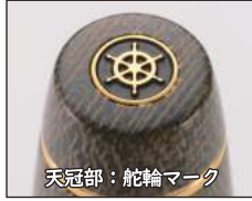
天冠部：舵輪マーク

軸素材にコットンマイカルタという天然素材を採用。使うほどに独特な艶を纏います。「未来に向かって書き手と時を共に歩んでほしい」という想いをVOYAGE(航海)の名前に込めました。